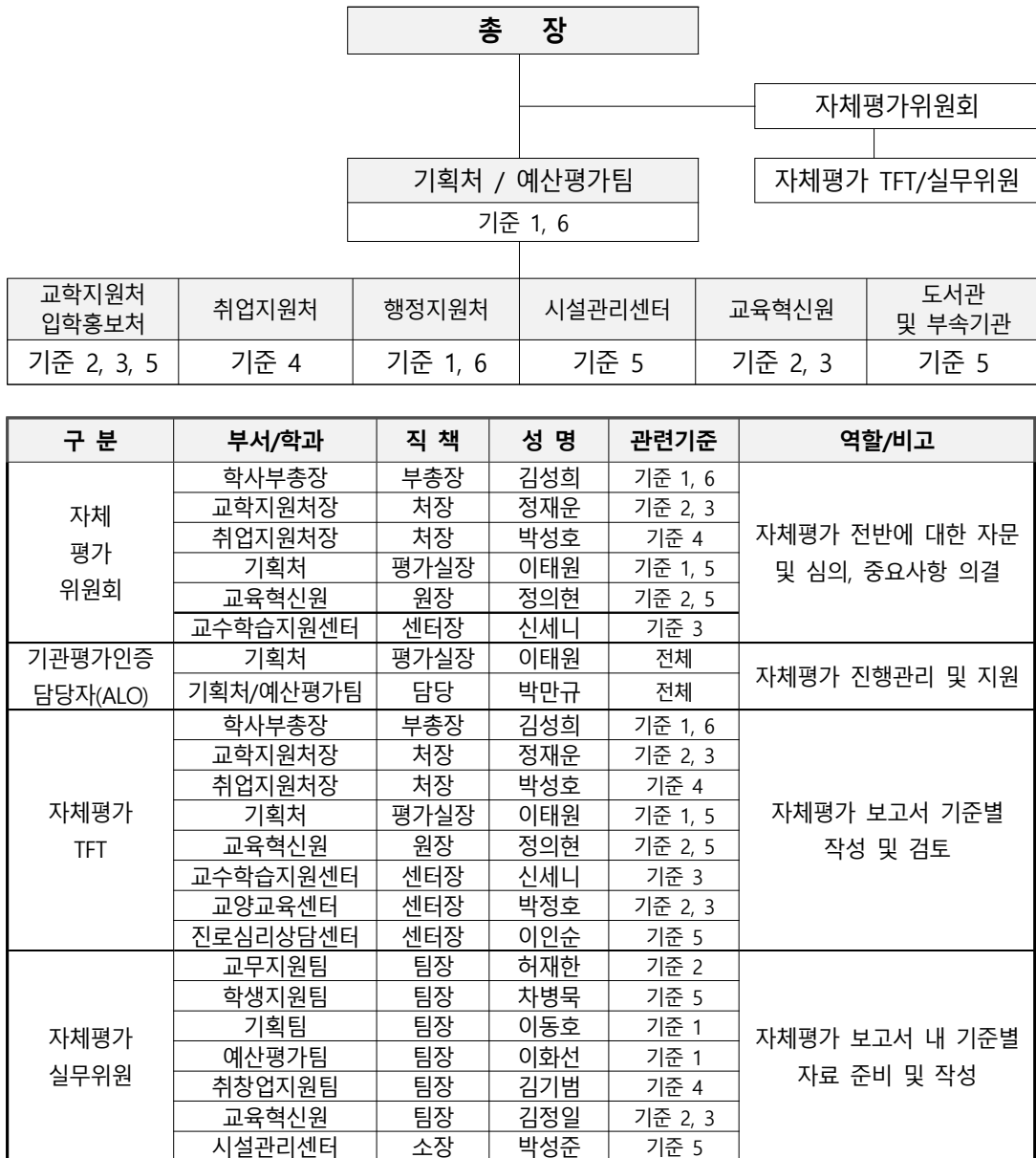
[그림 1-2] 자체평가 추진체계