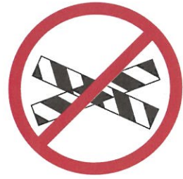
전용구역 표시 및 기기 훼손

부과기준 「환경친화적 자동차의 개발 및 보급 촉진에 관한 법률」 제11조의 2 및 제16조